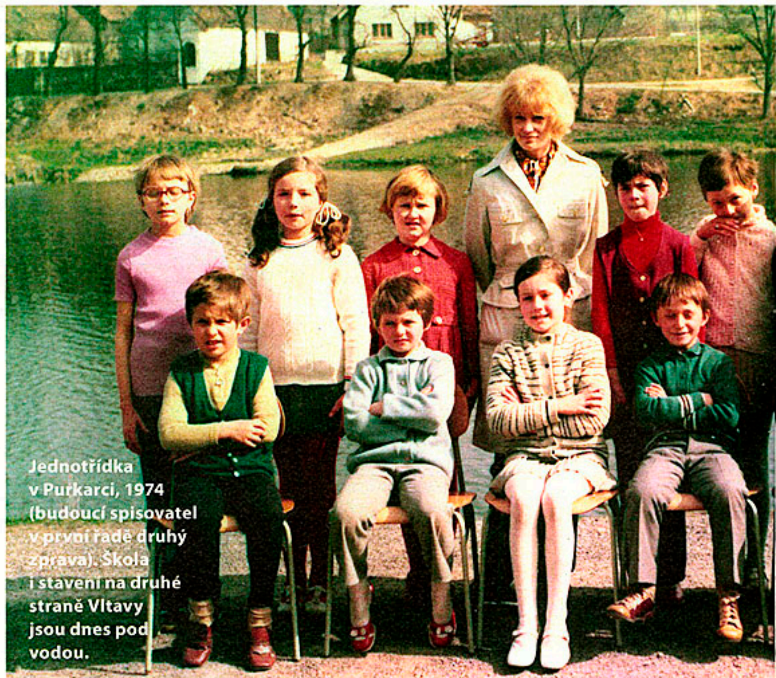
Jednotřídka v Purkarcích, 1974 (budoucí spisovatel v první řadě druhý zprava). Škola i stavení na druhé straně Vltavy jsou dnes pod vodou.

Já jsem odmala hodně a rád četl. A pak na gymplu, jako skoro každý, jsem začal psát básničky. Později jsem se dostal k povídkám – ale to už bylo na vojně, někdy v 90. letech. Jak říká Josef Škvorecký: Když